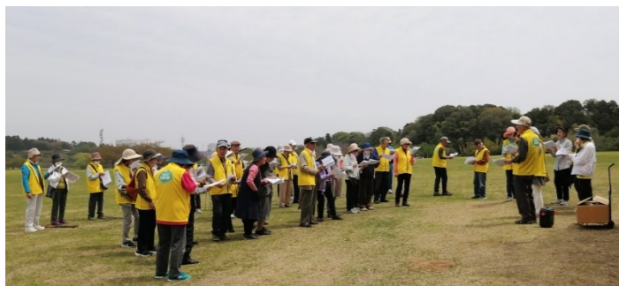
みんなでコーラス