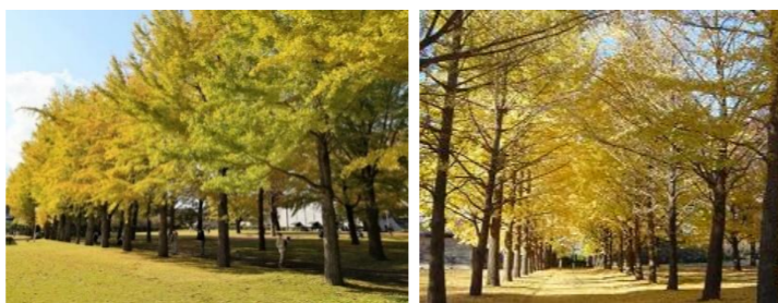
11月初旬「県立歴史館イチョウまつり」