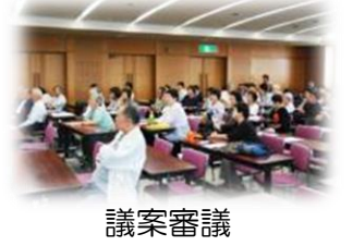
写真は昨年の総会風景です