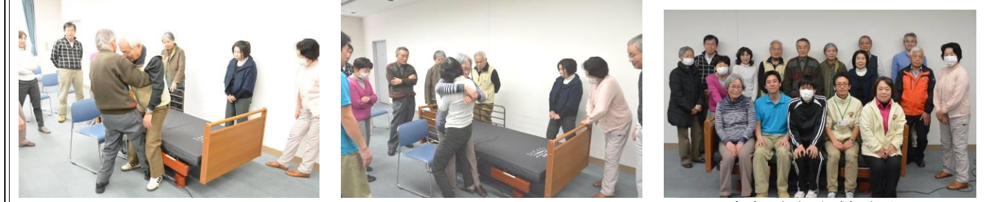
4. ベッドからの立ち上がり 5. ベッドから車椅子へ 参加された皆さん