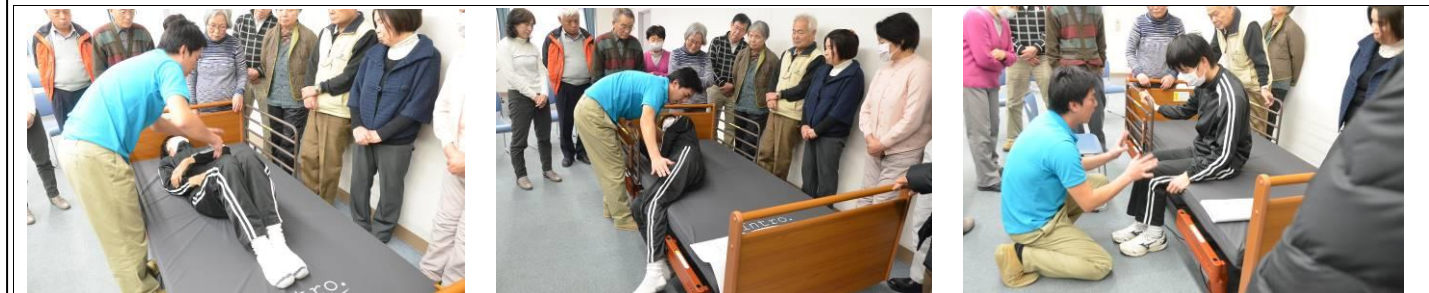
1. 寝返り 2. 起き上がり 3. 端座位

研修開催の目的は、介護保険法改正に伴い、厚労省では可能な限り住み慣れた地域で、自分らしい暮らしを人生の最期まで続けることができるように、地域包括ケアシステムの構築をめざしています。ナルクも自立・奉仕・助け合いをモットーに会員同士の助け合いボランティアでシニアの生きがいを創造してきました。これらのことから、地域とも連携した取組みが想定されますので水戸市東部高齢者支援センターと共に計画し実施しています。今後は2月26日(車椅子)、3月26日(認知症)、について受講しますので興味をもってお集り下さい。