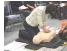
心臓マッサージ 30回

手順は 意識の確認⇒大声で人を呼び集める⇒救急車を呼ぶ人を指名⇒AEDを探す人を指名⇒呼吸確認⇒心臓マッサージとAEDの電気ショックを休まず！救急隊がくるまで繰り返します。