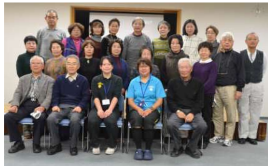
講師と講習修了の皆さん

AED (エーイーティ) は心臓麻痺の最初の段階の心臓が痙攣している状態を取り除く機械です。 使い方は簡単 蓋を開けると「電極パッドを取り出して貼り付けて下さい」-「離れて下さい」-「心電図を解析しています」-「電気ショックが必要です」-「ボタンを押して下さい」などと音声で指示をしてくれますので指示通りにすればいいのです。あわてずおちついてやれば誰でもできます。 ・水戸市内では公共施設やスーパー等に設置してあります。