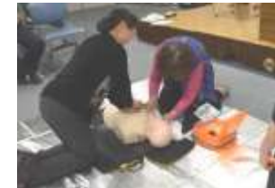
電極パッドを貼る